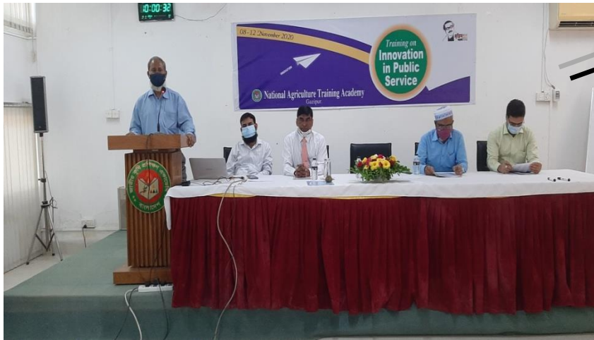
Opening Speech by DG, NATA