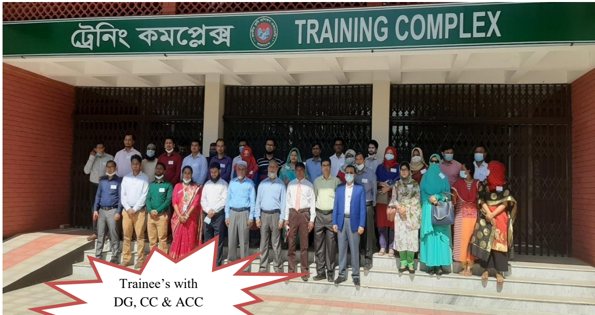
Trainee's with DG, CC & ACC