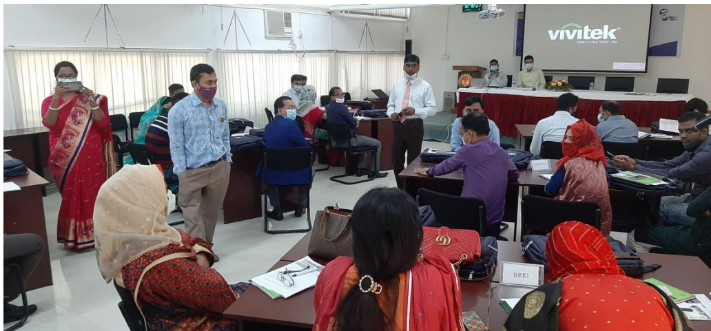
Trainee's with course co-ordinator's