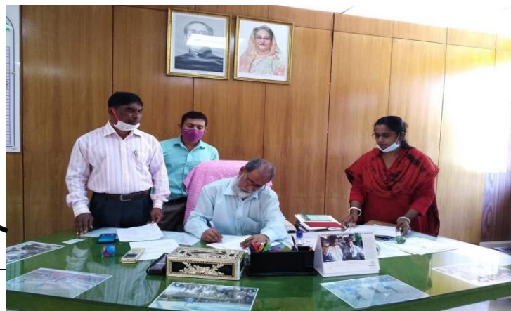
First Automation Certificate signed by DG, NATA