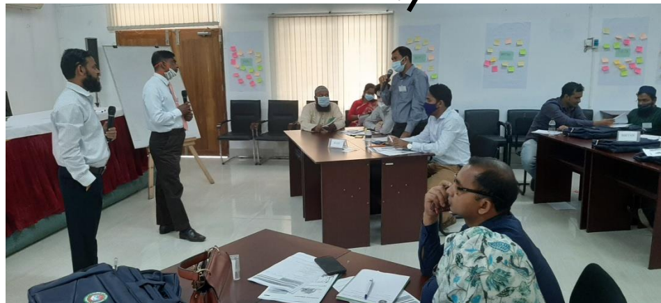
Discussion with Trainee's